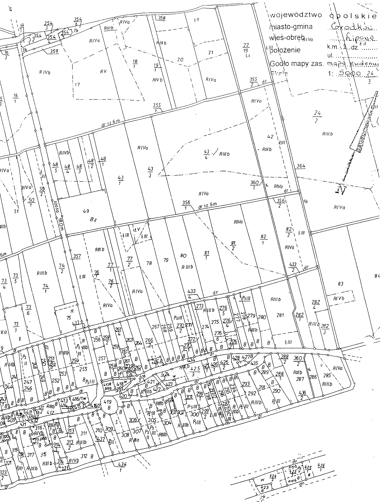
Rysunek poboczny Nr.3

województwo łódzkie miasto-gmina Grodzisk wieś-obręb Rypenski położenie ul. dz. II Godło mapy zas. mapa ewidencyjnej 1: 5000 24/3