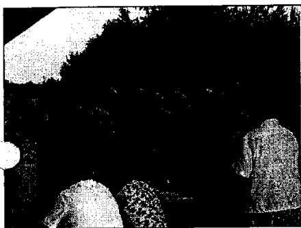
Ilustracja 1: Udział społeczeństwa w dniach Grodkowa

Zaletą tej corocznej imprez jest jej szeroki zasięg (obejmuje całą Gminę) oraz uczestnictwo wszystkich grup społecznych. Tym samym zarówno starsi, jak i młodzi mieszkańcy miasta i okolicznych miejscowości angażują się w aranżację imprezy, poznają walory i lokalnego środowiska, kultury, historii i tradycji.