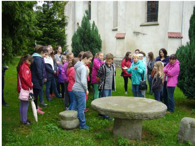
Wycieczka dla uczestników gminnych konkursów regionalnych