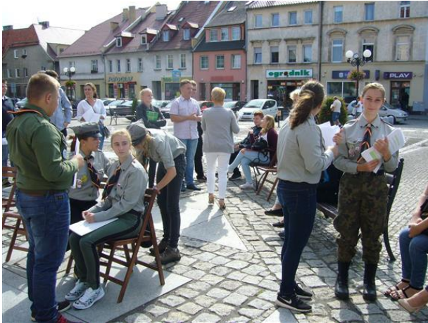
Narodowe czytanie „Lalki” B. Prusa