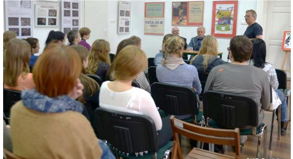
Otwarcie wystawy „Historia muzycznej jesieni”