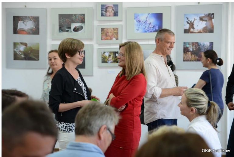
Wystawa „Twórczość kobiet – wdzięk czy szaleństwo”