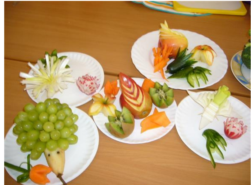
Warsztaty rękodzieła „Carving”