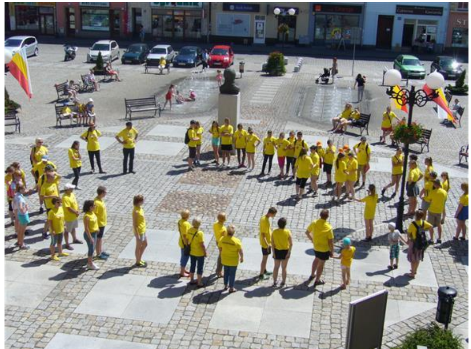
I Grodkowska Gra Miejska