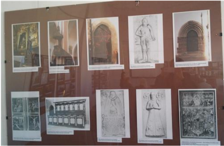
Wystawa „Kościoły Ziemi Grodkowskiej”