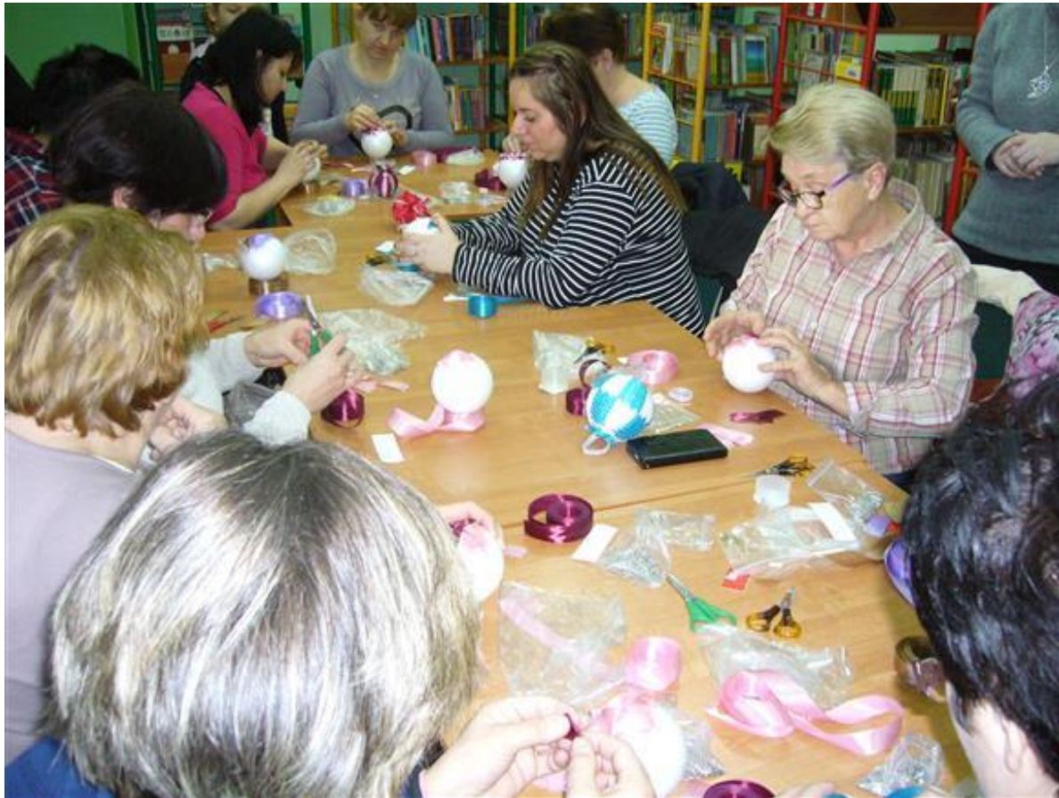
Warsztaty rękodzieła „Bombka karczochowa”