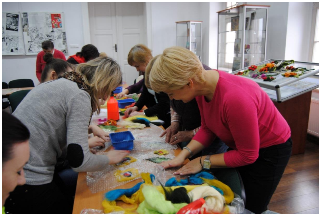
Warsztaty rękodzieła „Bizuteria robiona metodą filcowania na mokro”