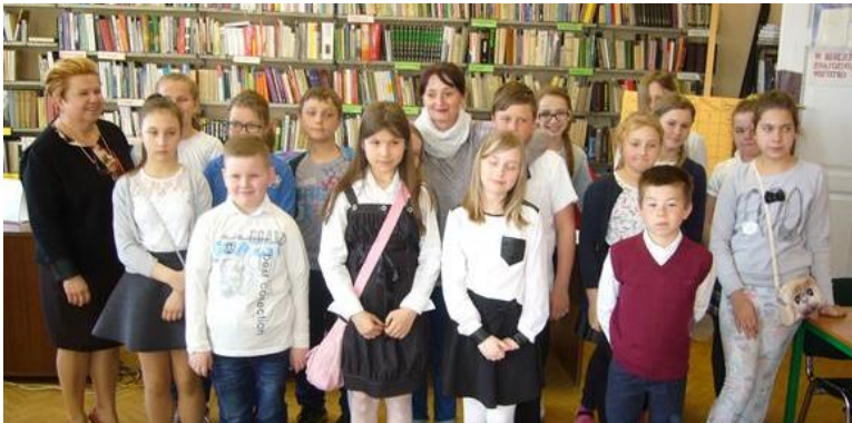
Gminny konkurs regionalny dla kl. IV „Czy znasz dzieje Grodkowa?”