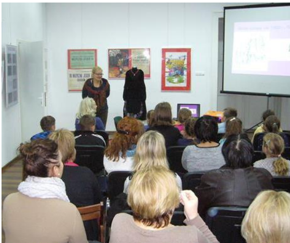
Wykład I. Jasińskiej „Ludowy strój rejencji opolskiej z uwzględnieniem ludowego stroju grodkowskiego”