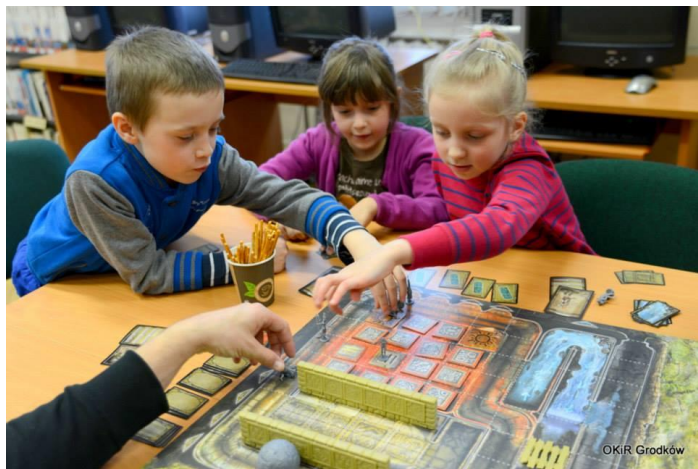
Dzień gier planszowych