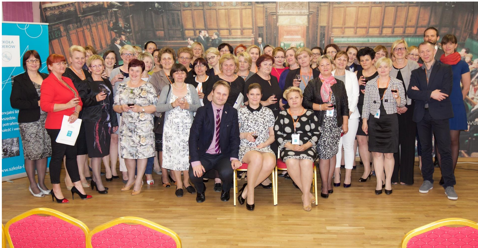
Konferencja dyrektorów bibliotek „Kieruj w dobrym stylu”