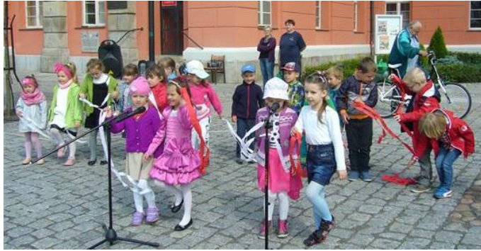
Czytanie w plenerze i występy przedszkolaków