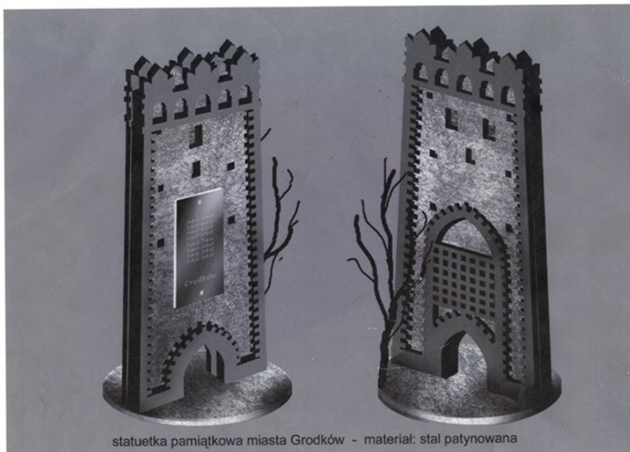
statuetka pamiątkowa miasta Grodków - materiał: stal patynowana

(na podstawie projektu autorskiego Marka Mikulskiego)