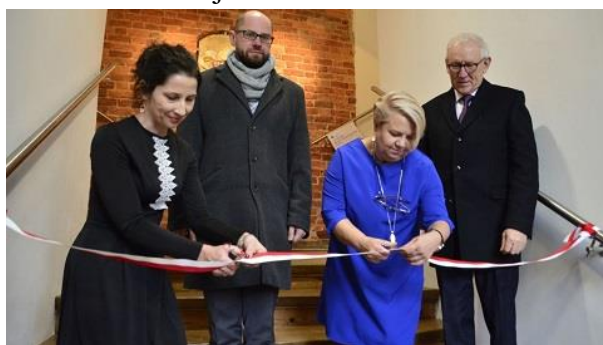
Fot. Rewitalizacja ratusza