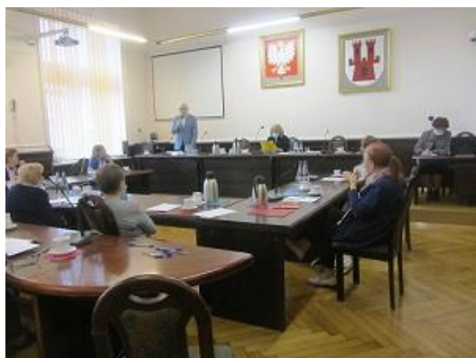
Fot. Posiedzenia Rady Seniorów

Rada Seniorów na swoim ostatnim posiedzeniu przedstawiła bardzo bogaty plan pracy ukierunkowany na seniorów.