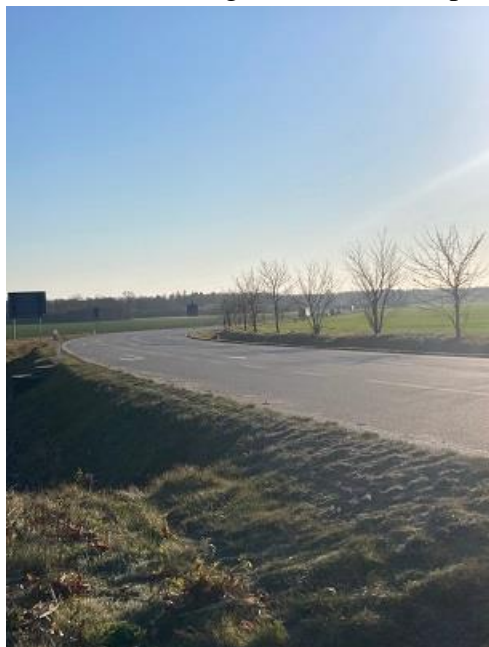
Fot. Odcinek drogi Grodków – Kopice