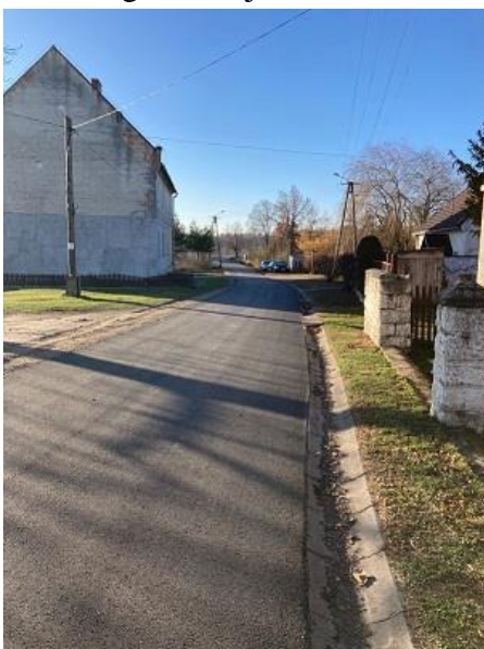
Fot. Droga w Wójtowicach