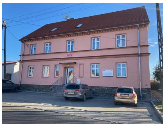
Fot. Świetlica w Wierzbniku