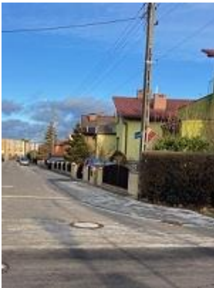
Fot. ul. Dąbrowskiej