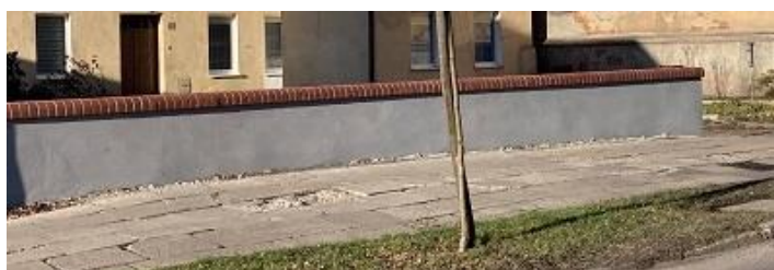
Fot. Bieżące remonty murków zabezpieczających

Wprowadzamy dokumentację na remont muru obronnego, remont zabezpieczający Bramę Ziębicką i były kościół ewangelicki.