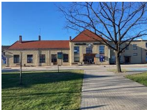
Fot. Budynek Dworca