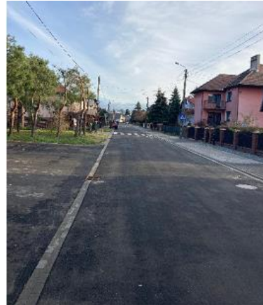
Fot. ul. Kochanowskiego