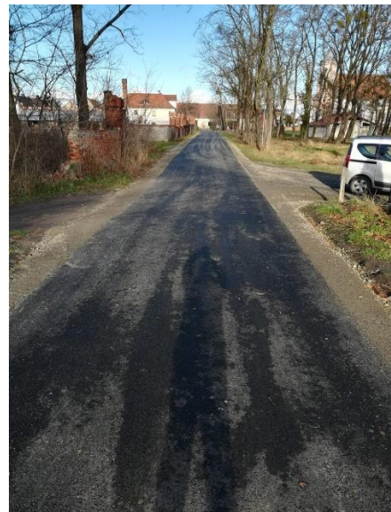
Fot. Droga w Kopicach