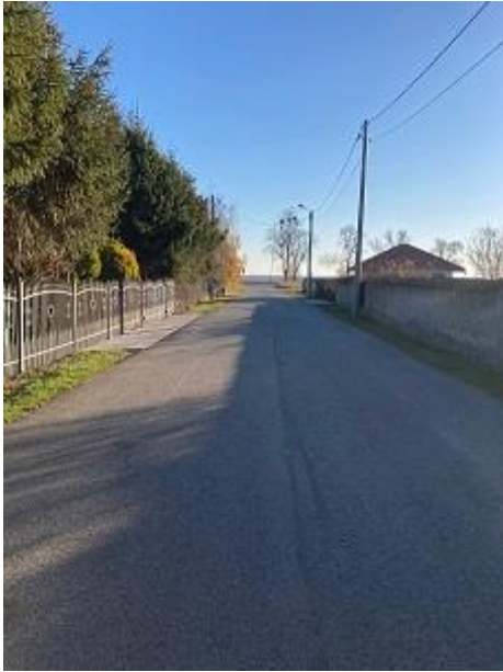
Fot. Droga w Nowej Wsi Małej