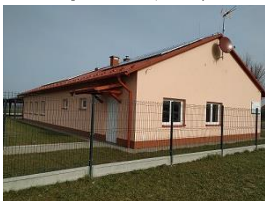
Fot. Sala Spotkań w Więcmierzycach