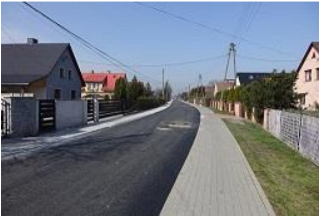
Fot. ul. Ogrodowa