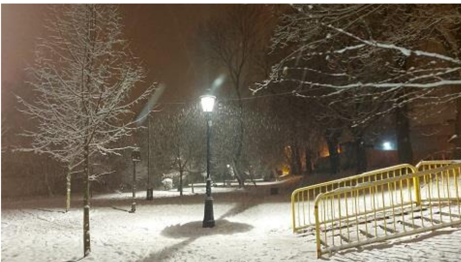
Fot. Park Jubileuszowy Partnerstwa Miast Grodków-Beckum

12) OŚWIETLENIE. W ramach umowy na bieżące utrzymanie oświetlenia ulicznego wymieniamy część opraw oświetleniowych na nowe typu LED. Zakończyliśmy montaż nowego oświetlenia w parku przy ul. Elsnera. Zakończyliśmy II etap rozbudowy oświetlenia ulicznego w gminie (miejscowości Kopice i Wierzbna). W 2022 roku wprowadzamy do budżetu projektowanie III etapu oświetlenia ulicznego w gminie Grodków. W 2016 roku w gminie było 1908 punktów świetlnych, natomiast w 2021 roku - 2332 punkty świetlne.