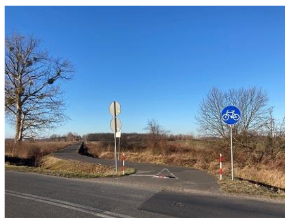
Fot. Ścieżka rowerowa