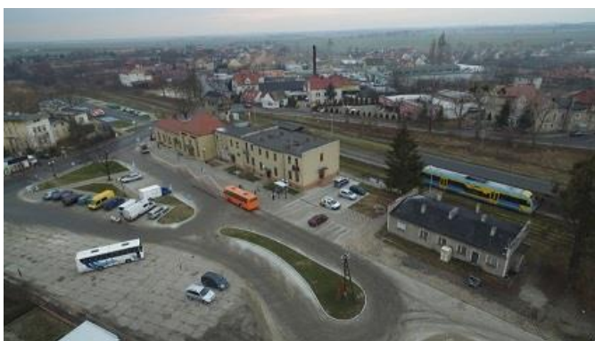
Fot. Plac dworcowy