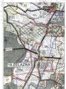
Wyrys ze studium uwarunkowań i kierunków zagospodarowania przestrzennego Gm. Grodków